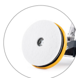
Vari tipi di pad