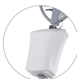
Serbatoio 12 litri (optional)