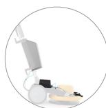
Spray system (optional)