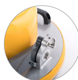
Sistema bloccaggio testata