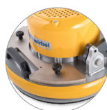
Possibilità uso pesi aggiuntivi (6,5 e 13 Kg - optional)