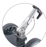
Snodo del manico